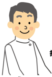
機能訓練 指導員の声

サーキットチェアは、マシントレーニングでは難しい持久性能の維持・改善が、集団で効率よく実施できます。